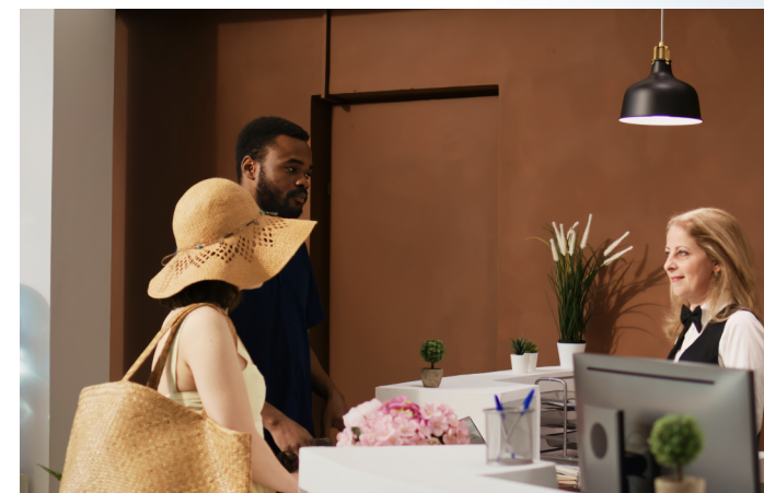
Υπάλληλος Υποδοχής Πελατών Ξενοδοχείου*