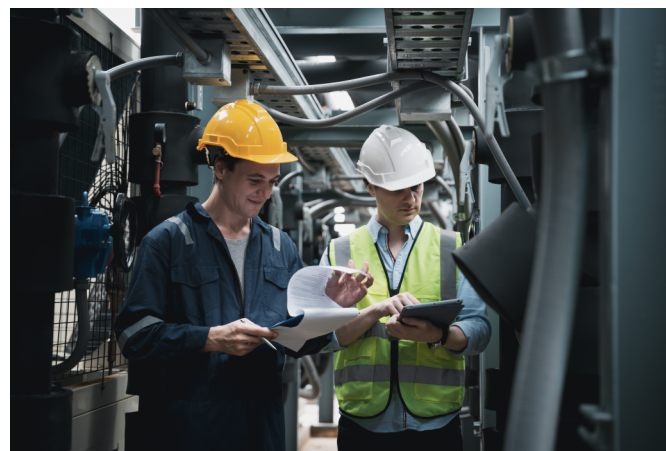
Τεχνίτης Ψυκτικών & Κλιματιστικών Έργων*